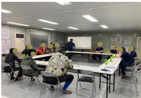
再発防止検討状況