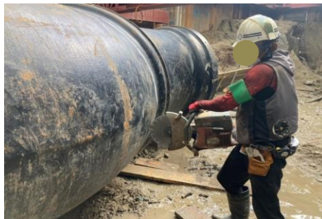
フェイスガードの使用